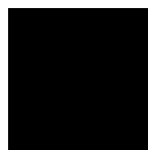
an der Linden, secretaris